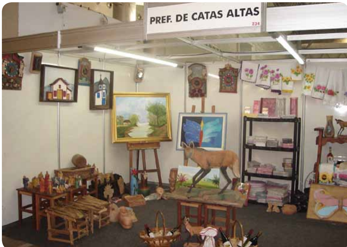
Estande da Prefeitura em evento no Expominas

Outra novidade deste ano foi a visita dos alunos das oficinas de cerâmica e pintura em tecido em parceria com o CRAS, proporcionando aos alunos vivenciarem a exposição e comercialização dos seus trabalhos e ampliarem o conhecimento em relação aos tipos, qualidade e preços do artesanato de várias partes do Brasil e da América Latina.