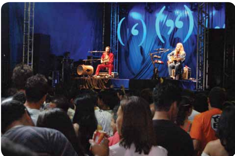
Show da banda Pouca Vogal foi uma das atrações da festa

Missas, procissões, barraquinhas, sorteios e shows marcaram o evento