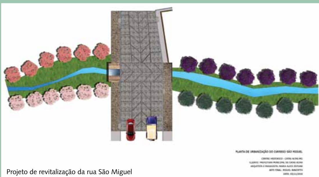
Projeto de revitalização da rua São Miguel